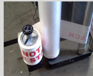
Optionnel: adaptateur pour pellicule imprimée.