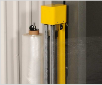
Chariot à chargement facile et rapide.