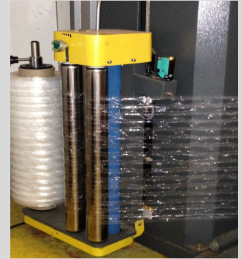
AirFlow™ Pellicule ventilée.