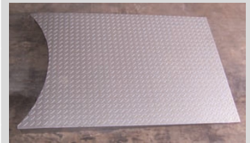
Optionnel: rampe en acier sur mesure pour le chargement des transpalettes.