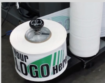
Optionnel: adaptateur pour pellicule imprimée.

Emballeuse à palettes semi-automatique à profil bas sans le chariot de préétirement. Système de freinage manuel qui étire jusqu'à 20%.